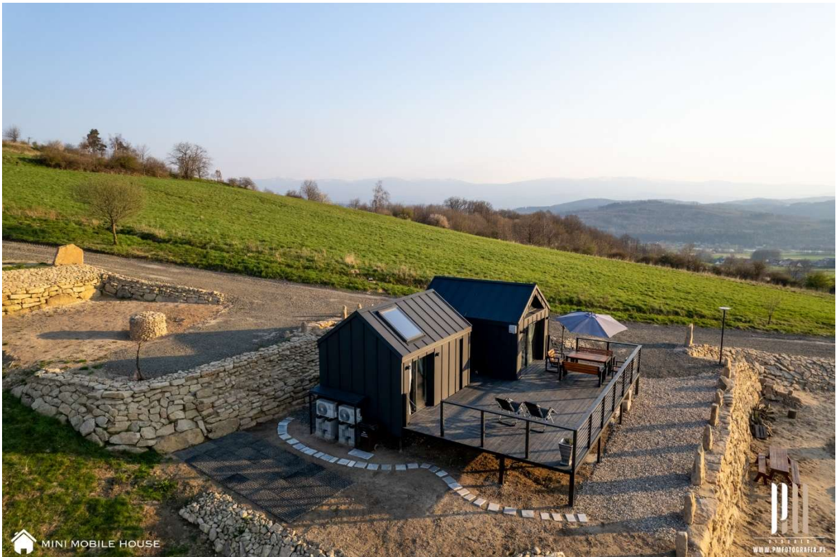
MINI MOBILE HOUSE