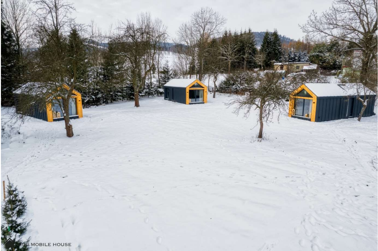
MINI MOBILE HOUSE